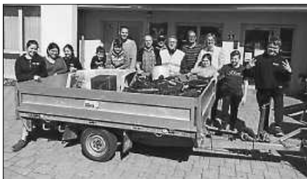
Auf dem Bild fehlt die Familie T. Keller.

das waren die größeren Funde bei der vergangenen Wald- und Feldputzede. Rund 20 Erwachsene und Kinder haben am Samstag, 30. März 2019, den Müll auf der Gemarkung Fulgenstadt eingesammelt. Hinzu kamen noch rd. 80 kg an Flaschen, Plastikfolien und -verpackungen, Hundekotbeutel und sonstiger Unrat.