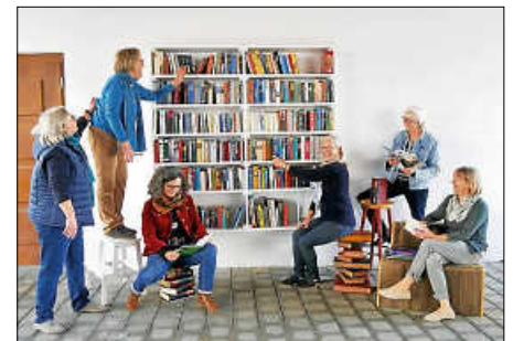
Lesestoff gibt's umsonst und zum Mitnehmen.

Der ursprüngliche Gedanke bei diesem Bürgerengagement ist: Geben und Nehmen in angemessenem Rahmen zu kultivieren. Dabei tut es der Zusammensetzung der Auswahl durchaus gut, wenn die „attraktiven“ Bücher nach Gebrauch auch wieder zurückkommen. Auf jeden Fall wertet es das Projekt auf, wenn sich alle Benützer ein bisschen „zuständig“ fühlen. Das kann man auch immer wieder feststellen, und darüber freuen sich nicht nur die Initiatorinnen. Wie auch in anderen Städten, ist die Idee vom Bücheraustausch in einem öffentlichen Regal in Bad Saulgau gut angekommen, und es ergänzt die öffentliche Bibliothek um einen kleinen Baustein, der nicht zu verachten ist. Das Bücherregal-Team wünscht auch in Zukunft viel Vergnügen beim „Stöbern“, denn trotz digitalem Zeitalter kommt Lesen wohl doch nicht so schnell aus der Mode.