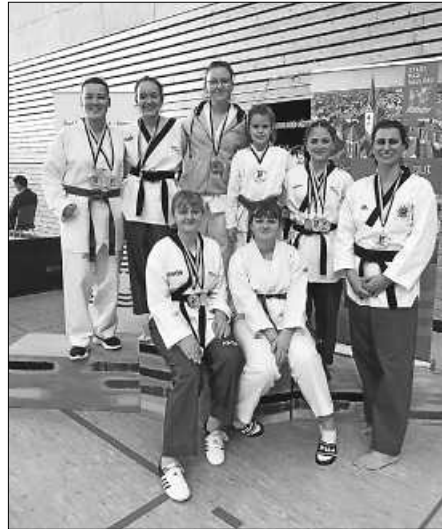
Das erfolgreiche Team des TSV Bad Saulgau

Die Bad Saulgauer Taekwondo-Sportler konnten mit 8 Teilnehmerinnen in den verschiedenen Wettbewerben mit 6 x Gold, 2 x Silber und 1 x Bronze sowie Platz 8 in der Vereinswertung glänzen.