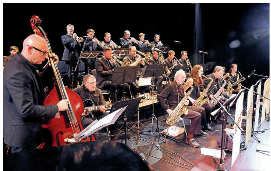
S'Wonderful: Die Bigband Bad Saulgau ist im Stadtforum zu hören.

Es ist ein Highlight im Saulgauer Veranstaltungskalender: das Jahreskonzert der Bigband Bad Saulgau am 9. November um 20.00 Uhr im Stadtforum