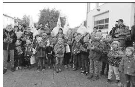
Die Kinder präsentieren stolz ihre selbstgestalteten Rübengeister.

Am Samstag, 26.10.2019, veranstaltete der Freizeit- und Narrenverein Haid-Bogenweiler-Siessen seinen diesjährigen Rübengeisterumzug durch Bogenweiler. Zahlreiche Familien haben sich am Dorfgemeinschaftshaus eingefunden, um aus den bereitgestellten Rüben ihren ganz individuellen Rübengeist zu schnitzen. Spontan mussten wegen großer Nachfrage noch zusätzliche Rüben nachgeordert werden. Die von jedem Kind persönlich bemalten und gestalteten Sammeltüten für die beim Umzug „ergeisterten“ Süßigkeiten durften natürlich auch nicht fehlen. Bei Einbruch der Dunkelheit startete der schaurig-schöne Rübengeisterumzug, der von den Strallegg'schen Burgeistern begleitet und mit hellen Leuchten stilvoll in Szene gesetzt wurde. Bei ihrer Süßigkeiten-Jagd durch verschiedene Stationen in Bogenweiler sagten die Kinder lautstark ihren Rübengeister-Spruch auf und konnten so ihre Tütchen füllen. Im Anschluss an den Rübengeisterumzug fanden sich alle teilnehmenden Kinder und Eltern sowie die Strallegg'schen Burgeister, Vereinsmitglieder und Bürger, welche die Stationen gestaltet hatten, wieder am Dorfgemeinschaftshaus ein und ließen gemeinsam den Abend am Lagerfeuer vergnüglich ausklingen. Herzlichen Dank an die vielen fleißigen Schnitzer; an all diejenigen, die sich bereit erklärt haben, die kleinen Geister vor ihrem Haus zu empfangen; und an alle emsigen Helfer. Ein ganz besonderer Dank geht an Mitglieder der FF Bogenweiler für die Unterstützung bei der Straßenabsicherung.