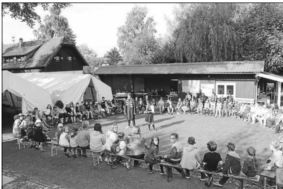
Im täglichen Morgenkreis mit Harry Potter und Pansy Parkinson

Per Telefon zum Ausbildungsplatz Lehrstellenbörse am Freitag, 17. September 2021 , zwischen 13:30 und 16:30 Uhr bei der Nachvermittlungsaktion der regionalen Lehrstelleninitiative. Die Berufsberater der Agentur für Arbeit Balingen sowie Vertreter der Handwerkskammer und der Industrie- und Handelskammern warten darauf, dass die Drähte glühen. Sie können per Telefon noch einige freie Ausbildungsplätze anbieten, so dass es trotz Corona noch mit einem Ausbildungsplatz klappen kann. Und falls es im Wunschberuf nicht mehr geht, ist vielleicht noch eine interessante Alternative dabei. Folgende Telefonnummern können der Schlüssel zum Einstieg in das Berufsleben sein: 07433 951-393 ist die Ringschaltung des Expertenteams der Berufsberatung. Die Ausbildungsberaterin der IHK Reutlingen erreicht man unter 07121 201-165, die Ausbildungsberater der IHK Bodensee-Oberschwaben unter 0751 409-234. Der Ausbildungsberater der HWK meldet sich unter 07121 2412-265.