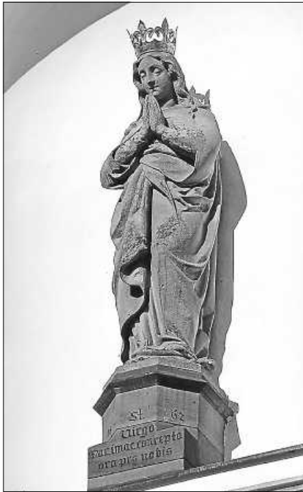
Marienstatue an der Liebfrauenkirche

Seelsorgeeinheit Sankt Johannes Baptist Bad Saulgau