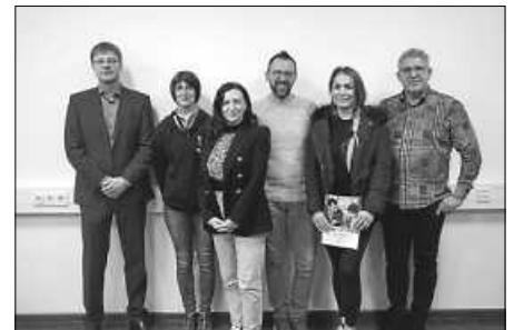
Der Elternbeirat 2022 der Helene-Weber-Schule

Aus 34 Klassen und von rund 600 Schülerinnen und Schülern waren Erziehungsberechtigte und Vertreterinnen und Vertreter der Ausbildungsberufe eingeladen, sich über die aktuelle Situation an der Schule zu informieren, Fragen zu stellen und Antworten zu erhalten sowie Lösungen für anstehende Schwierigkeiten zu finden. Angeregte Gespräche, interessiertes Zuhören und das eine oder andere Lachen prägten die Atmosphäre. Auch Vertreterinnen und Vertreter der Eltern wurden gewählt.