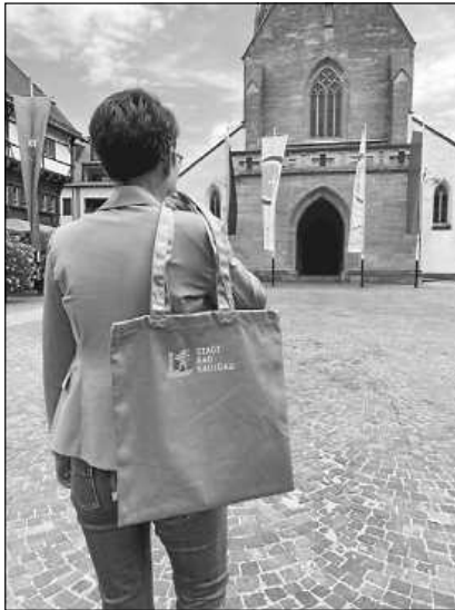
Dezent und trotzdem lässig: der neue Bad-Saulgau-Beutel

Kosten: 10 Euro Tourist-Information Bad Saulgau Hauptstraße 56, 88348 Bad Saulgau