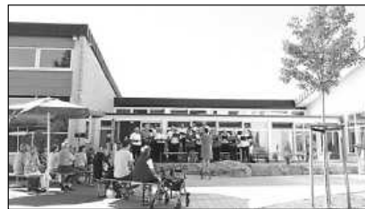
Sommerserenade im Schulhof

Am 23. Juli veranstalten Popchor und Liederkranz Reinhardtsweiler eine musikalische Sommerserenade. Beginn ist um 18.00 Uhr auf dem Schulhof der Grundschule Reinhardtsweiler. Die Serenade findet bei jedem Wetter statt. Anschließend laden die Chöre zu Getränken, Grillwürsten und Pommes ein.