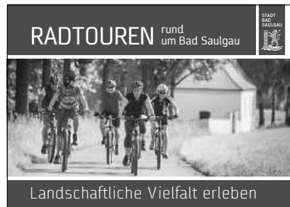
Ob klassisch in gedruckter Form oder digital auf unserer Website: die „Radtouren rund um Bad Saulgau“

Broschüre „ Radtouren rund um Bad Saulgau “ mit insgesamt neun abwechslungsreichen Routen um unsere Kurstadt. Sie können die Broschüre und die Touren ebenfalls auf unserer Website https://www.bad-saulgau.de/tourismus/entdecken/wandern-und-radfahren/radfahrkarten/rund-um-bad-saulgau/ herunterladen. Tour 1 - Das Ried mit Alpenfernsicht und Schloss Altshausen Tour 2 - Das Kloster und die Bad Saulgauer Natur Tour 3 - Auf Sichtweite mit den Windrädern bis nach Bad Buchau Tour 3a - Tagestour bis nach Bad Buchau und um den wunderschönen Federsee Tour 4 - Familientour vorbei an den Schwarzachtalseen Tour 5 - Durch den Wald zum Hoßkircher See und zurück Tour 5a - Tagestour mit Weitblick zum Höchsten Tour 6 - Zum Bussen und zurück Kleine Runde 1 - zur Erholung und Entspannung Kleine Runde 2 - zur Erholung und Entspannung Kleine Runde 3 - zur Erholung und Entspannung