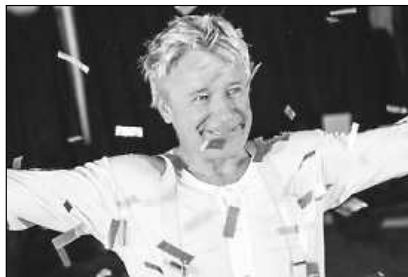
Jörg Schüttauf

geht eine Ära zu Ende, die mit Namen wie Josef Meinrad, Elisabeth Flickenschildt oder Götz George verbunden ist. Großartige Schauspieler werden auch weiterhin in Bad Saulgau zu sehen sein. So gibt es in der kommenden Saison etwa ein Wiedersehen mit dem grandiosen Peter Bause in Thomas Bernhards legendärem „Theatermacher“. Aber auch mit Jörg Schüttauf alias Tatort-Kommissar Dellwo, der den nahezu vergessenen Operettenkönig Paul Abraham wieder aufleben lässt. Dazu sechs weitere Inszenierungen, die eine abwechslungsreiche und spannende Theatersaison versprechen. Der Spielplan liegt in Buchhandlungen, Banken, im Alten Kloster, der Tourist-Info sowie im Rathaus aus.