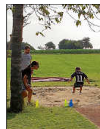
Bundesjugendspiele 2023 GS Renhardsweiler