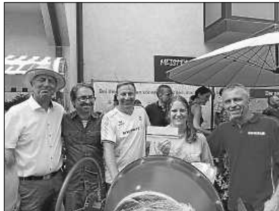
Eine Besucherin gewinnt einen der neuen UBS-Gutscheine beim Happy Family Day, verlost von Expert, Toom und VitaBad.