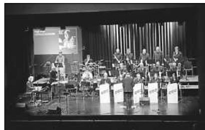
Die Bigband Bad Saulgau lädt zum Jahreskonzert im Stadtforum ein.