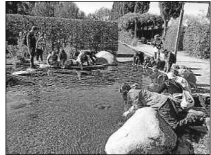
Auch im Wasser gibt es viel zu entdecken