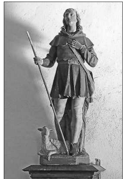
Hl. Wendelin, Kapelle St. Wndelin Sießen

Seelsorgeeinheit Sankt Johannes Baptist Bad Saulgau