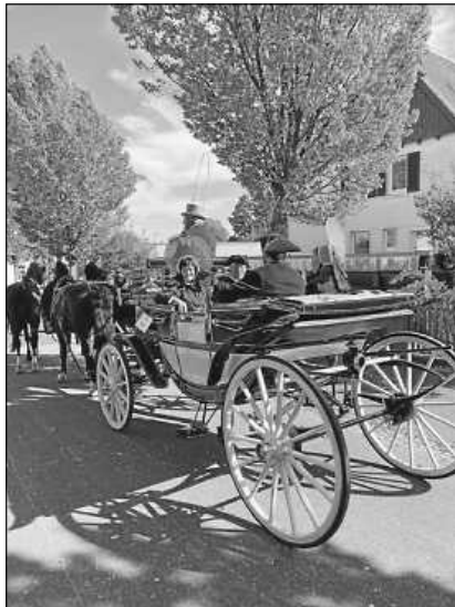
Trachtenverein nimmt im Landauer Platz.

Zwei Trachtenpaare vertraten den Heimat- und Trachtenverein Saulgau beim Fuhrmannstag in Bad Schussenried. Im 4-spännigen Landauer durften die Trachtenträger den tausenden Festbesuchern am Straßenrand zuwinken und den Umzug bereichern. Eine nicht alltägliche Kutschfahrt bei herrlichem Spätsommerwetter war wieder einmal gelebte Tradition für Heimat, Brauchtum und Kultur.