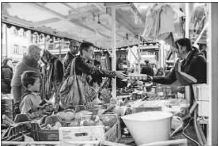
Frisch, regional, saisonal und immer herzlich: der Wochenmarkt in Bad Saulgau.

Der Wochenmarkt in Bad Saulgau ist aber nicht nur ein Ort des Einkaufs, sondern auch ein lebendiges Zentrum der Gemeinschaft der Bürger und Gäste. Hier treffen sich Menschen aus der Stadt und der Umgebung, um frische Produkte zu kaufen und sich dabei zu unterhalten. Die freundliche Atmosphäre auf dem Markt schafft eine einladende Umgebung, in der man nicht nur seine Einkäufe erledigen kann, sondern auch Nachbarn, Freunde und Bekannte trifft. Der Wochenmarkt ist somit nicht nur ein wichtiger Ort für den Handel, sondern auch ein sozialer Treffpunkt, der das Gemeinschaftsgefühl in Bad Saulgau stärkt und fördert.