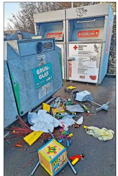
Containerstandort beim Bahnhof

In letzter Zeit nehmen die wilden Müllablagerungen an einigen Glas- und Kleidercon-