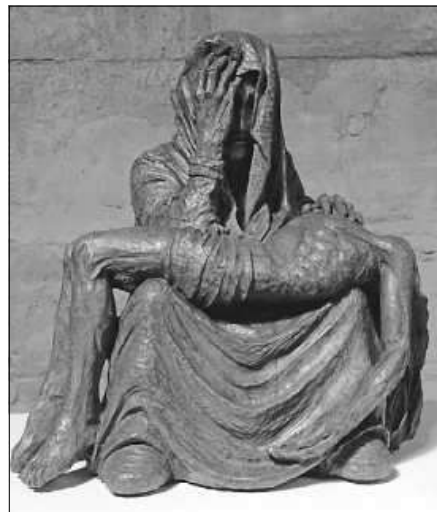
Foto: Hildegard Hendrichs (Skulptur)/Peter Weidemann (Foto), in: Pfarrbriefservice.de

sind an diesem Sonntag für die Fastenak- tion „Misereor“ bestimmt.