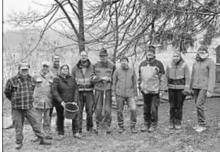
Die Helfer bei der KrötENZAUNAKTION in Wagenhausen

Die freiwilligen Helfer, die Stadtverwaltung und die Straßenmeisterei bitten die Verkehrsteilnehmer, an den durch Warnhinweise gekennzeichneten Bereichen besonders langsam und vorsichtig zu fahren.