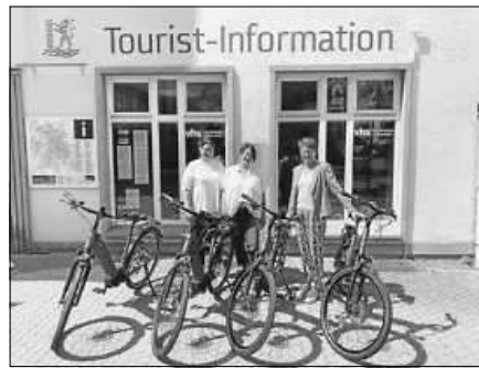
Besuchen Sie uns am verkaufsoffenen Sonntag in der Tourist-Information!