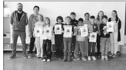
Die neuen Pausenengel der Berta-Hummel-Schule freuen sich über ihre Urkunden.

mel-Schule nach erfolgreich abgeschlossener Ausbildung zum Pausenengel ihre Zertifikate. Diese wurden in einem feierlichen Rahmen von der Schulleiterin Frau Fröhlich und der Schulsozialarbeit an die neuen Pausenengel überreicht. Als kleines Dankeschön gab es Schokolade dazu. Eltern, Schüler der dritten Klasse sowie bereits aktive Pausenengel der vierten Klasse nahmen daran teil.